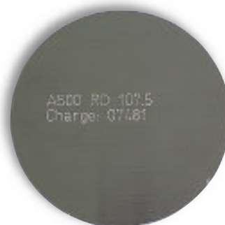
Sondermarkierungen marquages spéciaux