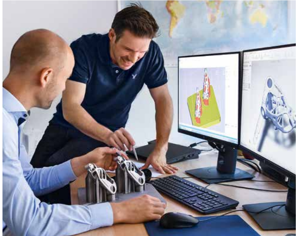
Vom 3D-Modell zum gedruckten Bauteil aus dem voestalpine Additive Manufacturing Center.

Beim sogenannten Laserstrahlschmelzen werden auf Basis von dreidimensionalen Konstruktionsdaten Bauteile Schicht für Schicht aus Metallpulver aufgebaut. Ausgangsmaterialien sind beispielsweise metallische Werkstoffe wie Stahl, Titan oder Aluminiumlegierungen – alles in Pulverform, feiner als Mehl. Beim selektiven Strahlschmelzen, zu dem auch das Laserschmelzen zählt, erzeugt ein Laser oder Elektronenstrahl die nötige Energiemenge und schmilzt auf der Oberfläche eines Pulverbettes die Kontur des Bauteils. Das Material erstarrt und bildet eine feste Schicht. Anschliessend senkt sich die Grundplatte um eine Schichtdicke ab und es wird erneut Pulver aufgetragen. Dies wiederholt sich so lange, bis das Teil vollständig aufgebaut ist. Das überschüssige Pulver wird gesiebt und wiederverwendet. Während in der Metallverarbeitung beim klassischen Drehen und Fräsen aus einem Block Material bis zur finalen Geometrie abgetragen wird, verarbeitet der 3D-Drucker nur das tatsächlich benötigte Material. Das macht das Verfahren sowohl wirtschaftlich als auch ökologisch interessant. Es wird gleichzeitig Zusatznutzen geschaffen, denn die Bauteile können flexibel und individualisiert produziert werden.